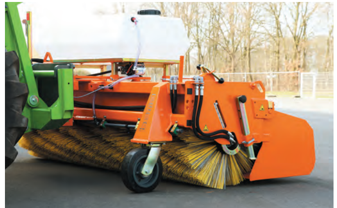
Überzeugt mit stabilen Rädern und großem Kehrwalzendurchmesser