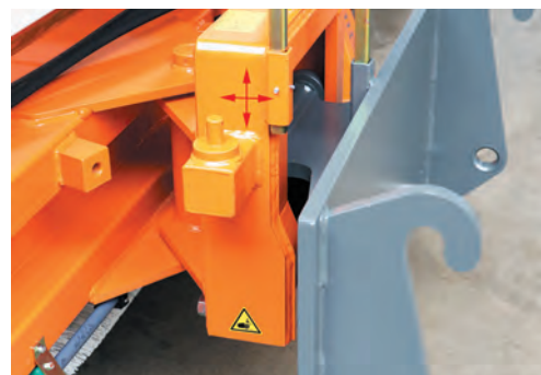
3D-Rollenniveaueingleich zur optimalen Bodenangepassung