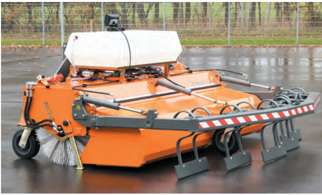
bema 35 Dual PowerMaster mit Schmutzsammelwanne, bema Aufkratzvorrichtung, zertifiziertes Kamerasystem und Wassersprüheinrichtung.