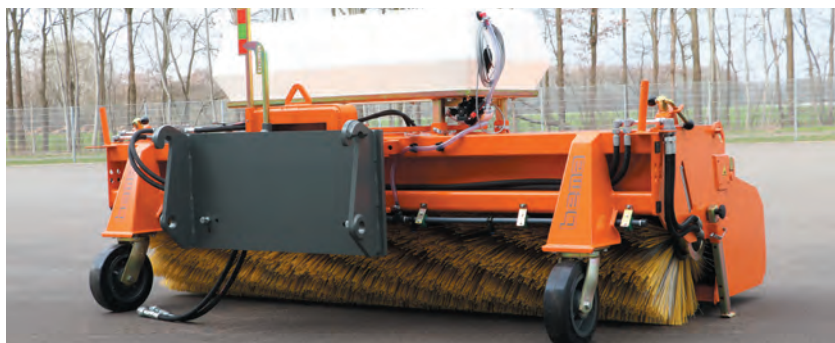
Schnellwechsellbau mit Rollenniveaueingleich und bema-Meter