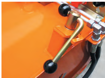
Stufenlose Verstellung des Anpressdrucks